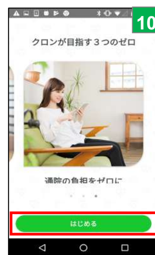
「はじめる」をタップし、インストール完了！ログイン画面へ進む