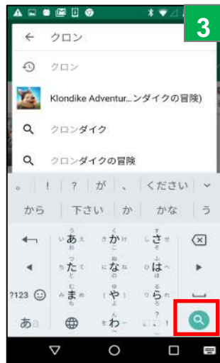
「虫眼鏡マーク」をタップ