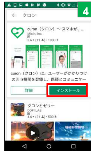
「インストール」をタップ